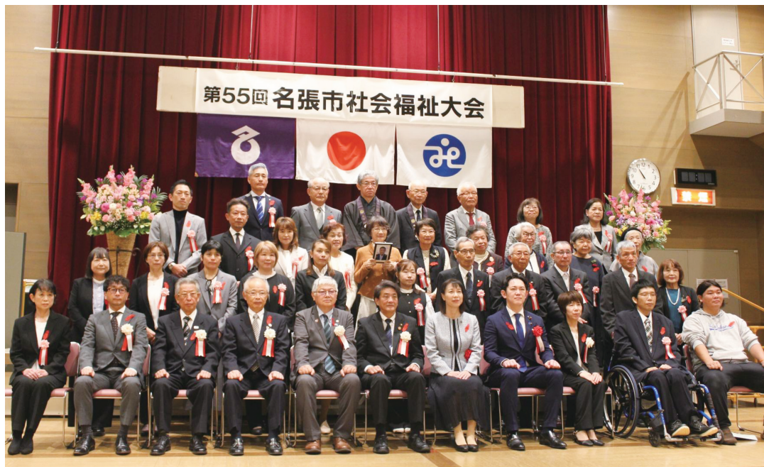
地域での功績をたたえ表彰しました