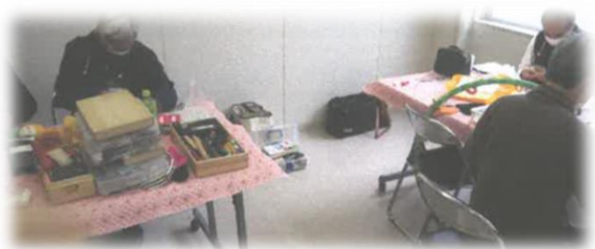
名張おもちゃ病院 ～活動の様子～