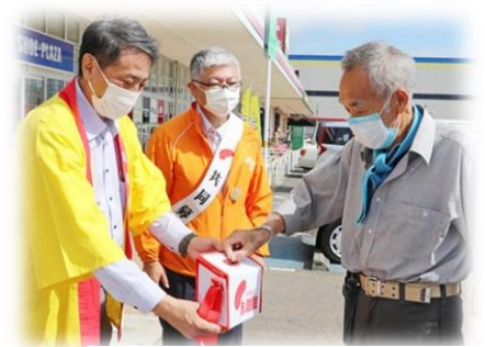
『伊賀タウン情報誌ユー』より 昨年の街頭募金の様子