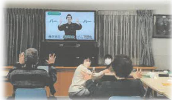
里お達者クラブ ～活動の様子～

私たちは地域の高齢者が気軽に集える場をと、皆で知恵を出し合って会を続けています。例会ではボランティアで食事会、茶話会のおやつ作りをしてみんなで食事、体操、歌などで楽しんでいます。また、90歳前後の方も多く経験を話していただき、学ぶことが多い大切な機会になっています。地域の福祉活動としてご協力をいただき、募金などで応援して下さる市民の皆様にも心より感謝申し上げます。