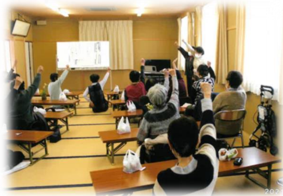
サロンソーレ ～サロンのようす～