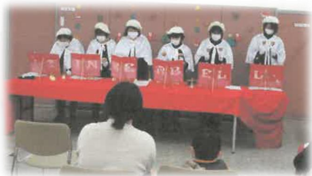
ティンカーベル ～演奏会のようす～

この一年間、活動できたのも、共同募金をして下さっている皆様のご協力があったことだと深く感謝しております。コロナで思うような活動ができませんが、少しでも皆様のご期待に沿えるよう、これからもメンバー一同精進して、新しい曲を増やしたり、人形劇を楽しんでいただけるよう頑張ります。これからもご支援よろしくお願いいたします。