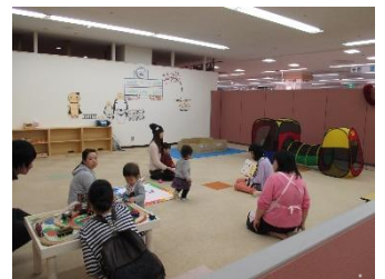
「おもちゃばこ」の様子