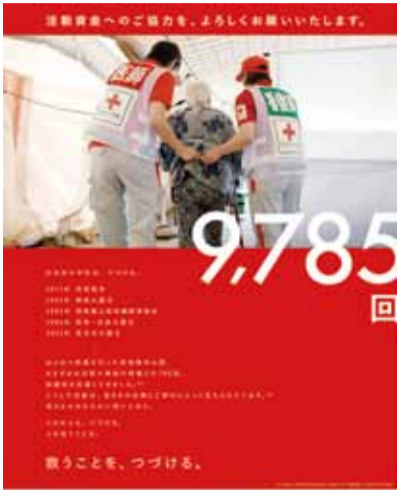
活動資金へのご協力を、よろしくお願いいたします。

【問い合わせ】日本赤十字社三重県支部名張市地区事務局 名張市社会福祉協議会 ☎63・1111