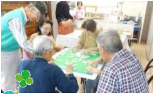
麻雀を楽しむ様子